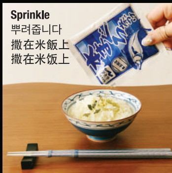
Sprinkle 뿌려줍니다 撒在米飯上 撒在米飯上

The origin of Ochazuke and hot water 오차즈케 분말, 데운 물 茶泡飯料包、熱水 茶泡飯料包、熱水