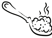
Spoon 숟가락 勺子 勺子