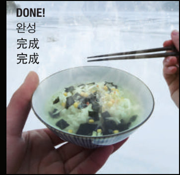
DONE! 완성 完成 完成

Ochazuke has been eaten for more than 1200 years; simply a meal that represents Japan indeed! Especially for hangover, a simple and quick meal, and during unwell physical condition, Japanese are always having this!