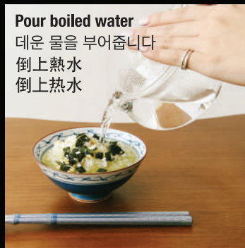
Pour boiled water 데운 물을 부어줍니다 倒上熱水 倒上熱水